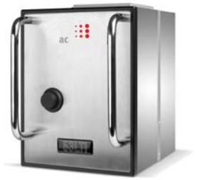
Druckkopf mit integrierter Steuerung

Einfach zu bedienender, robuster Druckkopf in edlem Design